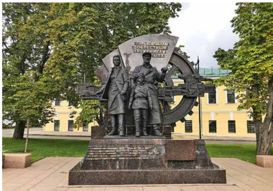
Рис. 2. Памятный знак «Горьковчанам доблестным труженикам тыла» в Нижегородском Кремле, скульпторы А. Щитов, А. Симонов, К. Шаронов, архитектор С. Тимофеев, 2020 г.

Монумент сооружался в самые сжатые сроки: от эскиза до воплощения прошло два месяца. Авторы проявили большое упорство и творческую настойчивость. Скульптор А. Щитов лепил фигуры в Москве вместе с помощниками, отливку вели в разных городах. Постамент выполнили из камней, которые были в Ярославле на заводе. Скульптор А.А. Щитов: «Мне хотелось передать то время. Чтобы у тех, кто смотрит на этот памятник, было ощущение той эпохи. Очень долго выбирали и цвет бронзы, и камень. Когда я работал над ним, мне было интересно, как выглядели заводы той эпохи... Возникало ощущение мощи: работа в разрушенных цехах не прекращалась ни на день». 2 июля 2020 г. Нижнему Новго-