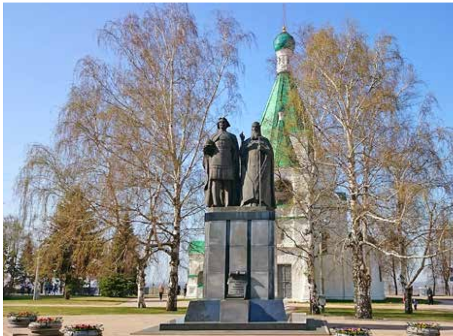
Рис. 1. Памятник князю Георгию Всеволодовичу и епископу Симону Суздальскому, скульптор В. Пурихов, архитектор В. Воронков, 2008 г.

те, что не мешает ее целостному восприятию. Поднятая правая рука епископа, которой он благословляет новый город, находится в геометрическом центре монумента, это придает замыслу особый смысл. Бронзовые фигуры установлены на пьедестале призматической формы, облицованном плитами из светло-серого гранита. Две тонкие вертикальные ниши и верхний пояс выполнены из черного гранита. Гранитный постамент на невысоком плинте сужается кверху, придавая динамику общей композиции (рис. 1). Внизу на фасадной стороне пьедестала — бронзовый картуш с надписью: «Основателю города святому великому князю Георгию Всеволодовичу и наставнику его святителю Симону от нижегородцев».