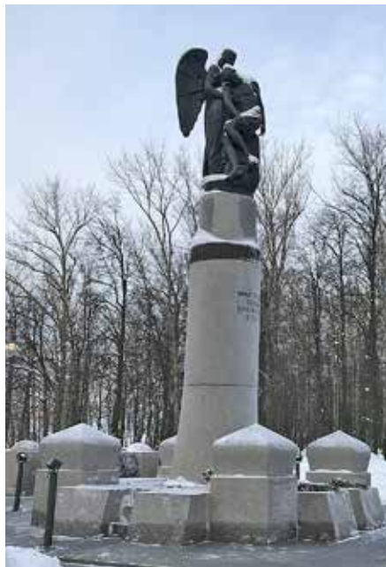
Рис. 6. Мемориальный комплекс нижегородцам, погибшим в Афганистане и Чечне, скульптор И. Лукин, архитектор С. Тимофеев, проект 1994 г., открытие 2002 г.