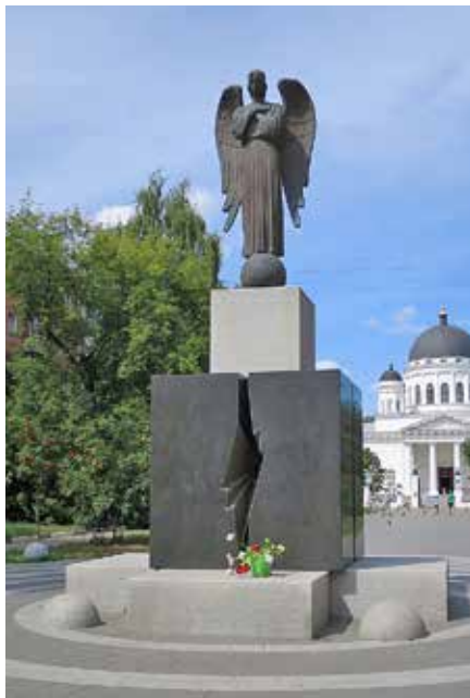
Рис. 7. Памятник нижегородцам, погибшим при ликвидации последствий аварии на Чернобыльской АЭС 26 апреля 1986 г., скульптор И. Лукин, архитектор С. Тимофеев, 2009 г.

неустойчивая форма, и это сообщает ангелу динамику: он застыл в своей скорби, но в любой момент словно может взлететь. Большие крылья готовы развернуться за спиной. Монумент имеет сложную динамичную композицию, которая продиктована одновременно его художественным решением и организацией пространства сквера. Двухметровая бронзовая статуя возвышается на сфере, которая венчает белый куб, установленный на черном пьедестале. Каждый из элементов композиции глубоко символичен в своей метафорической трактовке: расколотый камень кубической формы символизирует расколотую катастрофую мирную жизнь. Сфера символизирует атом, фигура ангела — скорбь ( Гельфонд 2022: 26 ).