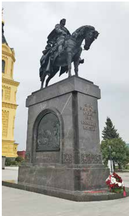
Рис. 9. Памятник Александру Невскому, скульптор А. Ковальчук, 2021 г.

Монумент был возведен к 800-летию Нижнего Новгорода и открыт 30 июля 2021 г. Монументальная бронзовая конная статуя на бронзовом плинте установлена на прямоугольном в плане пьедестале. Общая высота памятника составляет 13 м, высота самой скульптуры 6 м. Такие пропорции работают на создание цельного и выразительного образа. Скульптор изобразил молодого князя в боевой одежде с непокрытой головой. Всадник словно застыл в раздумье перед красотой открывшейся панорамы нагорной части и Кремлевского холма. Пьедестал облицован плитами из темно-вишневого гранита. Он решен в строгих формах и пропорциях, имеет развитую профилированную базу и антаблемент. «Вынутые» углы подчеркивают самоценность каждого фасада. На фасаде, обращенном к реке, накладными бронзовыми буквами выполнена надпись: «Святой благоверный князь Александр Невский». На боковых фасадах постамента в нишах с перспективными обрамлениями и полуциркульными завершениями расположены бронзовые картуши, изображающие сцены из жизни князя (рис. 9).