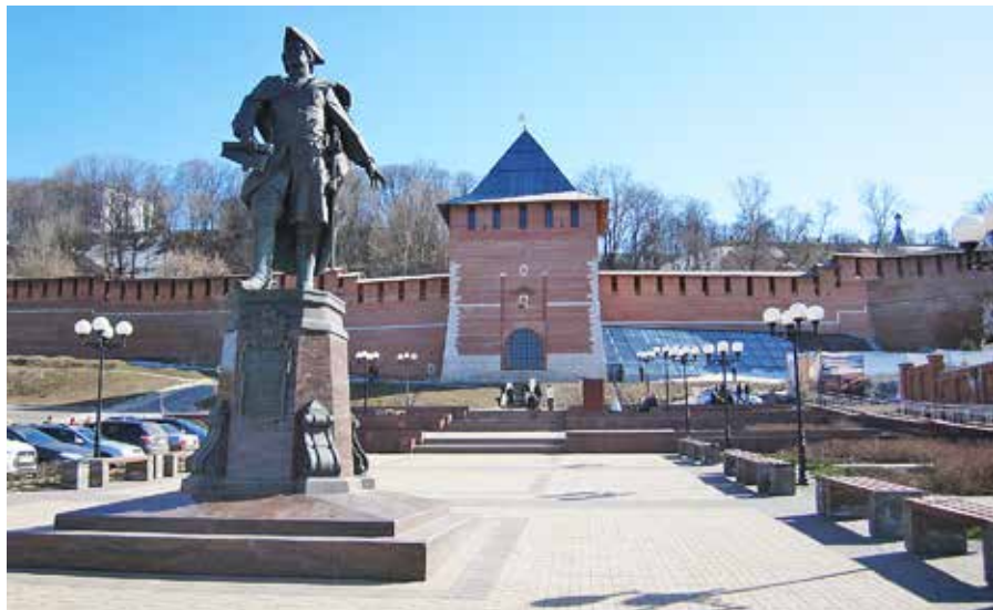
Рис. 3. Памятник Петру Первому, скульптор А. Щитов, архитектор С. Шорохов, 2014 г.

роду было присвоено почетное звание Российской Федерации «Город трудовой доблести», и к этому важному событию было приурочено открытие памятника.