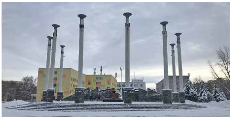
Рис. 5. Памятный знак «Победа 1945 г.», архитектор С. Тимофеев, 2000 г.

Заслуженный архитектор РФ С. А. Тимофеев рассказывает о своем творческом замысле: «Площадь — большое пространство, которое необходимо было организовать именно с по-