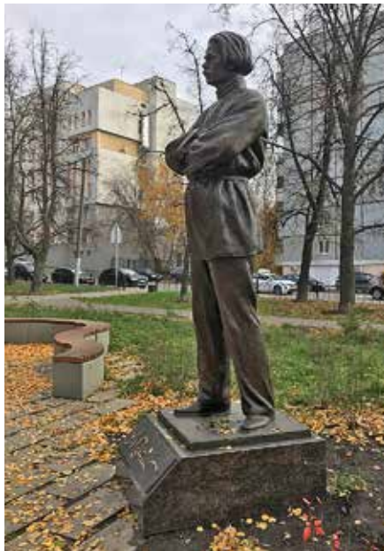
Рис. 8. Копия памятника М. Горькому (скульптор А. Кикин, начало 1940-х гг.), скульптор А. Щитов, 2021 г.

Бронзовый памятник М. Горькому открыли в Ковалихинском сквере 15 сентября 2021 г. Копию памятника, выполненного скульптором А. В. Кикиным в начале 1940-х гг. в парке Кулибина, выполнил скульптор А. А. Щитов. Первоначально памятник был сделан из гипса и бетона, в 2012 г. его демонтировали из-за установки часовни. Расположение на ул. Ковалихинской представляется очень уместным: сквер находится в непосредственной близости от двух объектов культурного наследия федерального значения, связанных с именем писателя. Это усадьба Кашириных, где в 1868 г. родился и до 1871 г. жил А. М. Пешков, и дом Н. Ф. Киришбаума по ул. Семашко, 19 (архитектор М. К. Ястребов). Здесь в 1902–1904 гг. находилась последняя квартира М. Горького в Нижнем Новгороде. Скульптор Алексей Щитов подчеркивает, что место для размещения выбрано удачно: «Горький бывал здесь, он даже в своих произведениях описывает его. Это новое рождение памятника, он удачно вписался в окружающее пространство». Памятник имеет достаточно камерный масштаб, он органично вписался в окружающее пространство (рис. 8). Вокруг него будет выполнено благоустройство и озеленение в виде клумб и газонов.