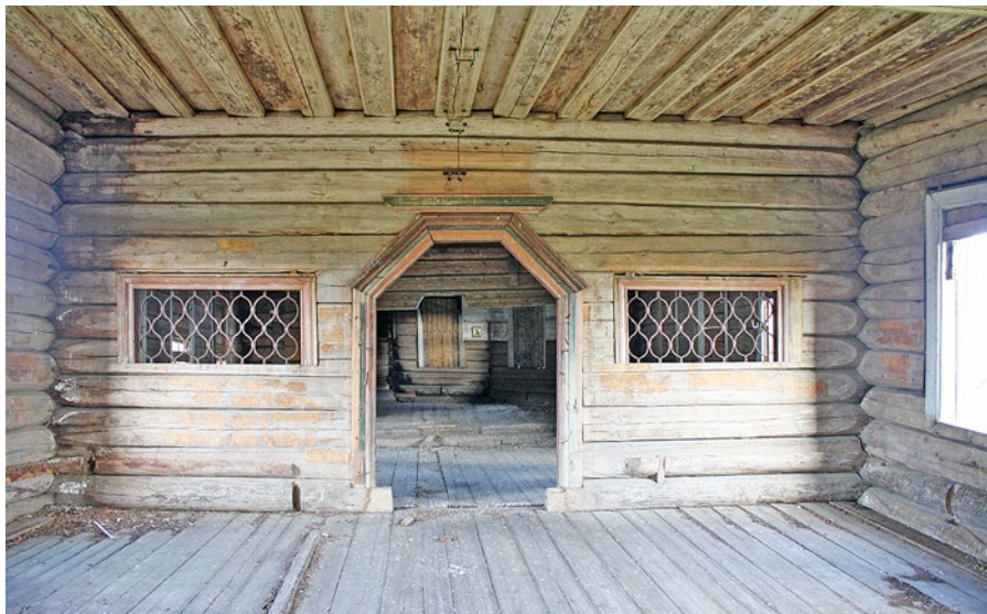
Рис. 3. Церковь Рождества Пресвятой Богородицы. Вид на западную стену трапезной. Фотография автора, 2015 г.