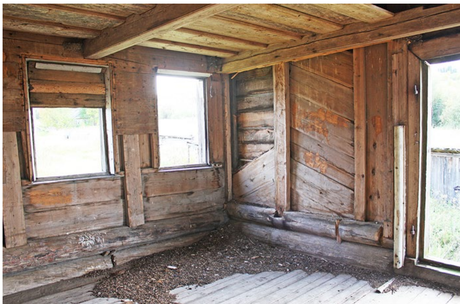
Рис. 4. Церковь Рождества Пресвятой Богородицы. Вид на юго-западный угол притвора.