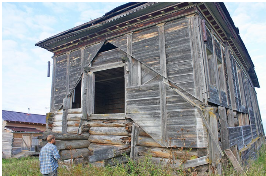
Рис. 5. Церковь Рождества Пресвятой Богородицы. Западный фасад, следы от двухвсходного крыльца. Фотография автора, 2015 г.

Церковь была закрыта в 1930-е гг., завершения были сломаны и устроена общая протяженная двускатная крыша. В советское время здание использовали в качестве зернохранилища.