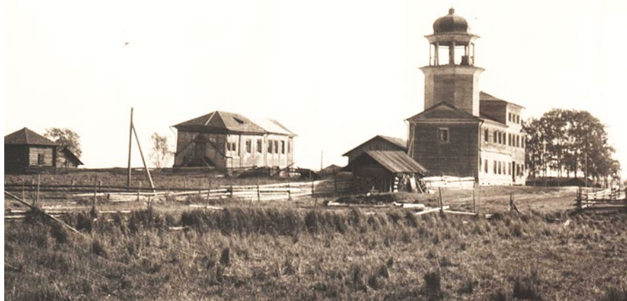
Рис. 1. Храмовый комплекс в д. Болкачевская. МБУК Шенкурский районный краеведческий музей. Научно-вспомогательный фонд, № 1849, 1960-е гг.

В ведомости о церкви Шенкурского уезда Усть-Пуйского одноклирного прихода за 1880 г. сообщается следующее: «...В 1855 г. с дозволения Преосвященного Варлаама, на ней перекрыта крыша и вся церковь снова перекрашена на счет общества... а в 1879 году глава и купол на ней обшиты белым железом, и на главе, вместо деревянного, поставлен железный крест... Ограда вокруг церковью была деревянная решетчатая,