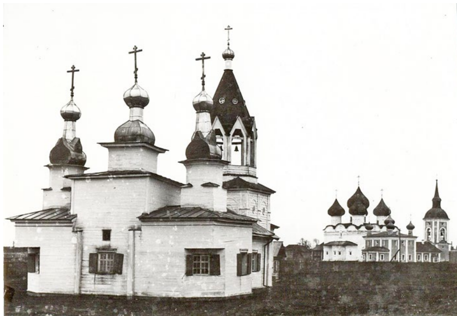
Рис. 2. Церковь Спаса Нерукотворного Образа на Валушках XVII в. в Каргополе. Фотография 1908 г.

все эти объекты не сохранились. На сегодняшний день форма бочки встречается только в виде завершения алтарного прируба. Единственный пример сохранившегося храма с бочкой над основным объемом — это церковь Благовещения Пресвятой Богородицы в деревне Пустынька (1719–1725 гг.) Плесецкого района Архангельской области (Бодэ 2019: 252). Единственный пример сохранившейся часовни — Георгиевская часовня 1732 г. в д. Дывлевская (Котажка) Шенкурского района Архангельской области (Зинина 2018: 35–44).